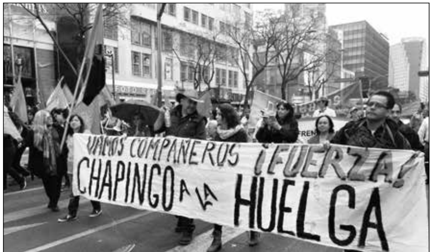
Prehuelga, 31 de enero de 2017, la cita fue con trabajadores de toda la curnia, Marcha gigantesca con la UNT, El STAUACH participó con un pequeño contingente, Anunciábamos el estallamiento a huelga, Así fue.