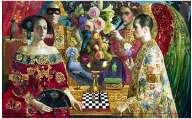
Las "Preciosas" demostraron tener el mismo derecho a la diversión que los hombres

con las llamas purificadoras de la leña verde, el lanzamiento de piedras hasta la muerte o la tortura de pena capital mediante métodos justificados en la moral cristiana, La mujer hubo de enfrentar oprobios, humillaciones y canalladas en sociedades netamente patriarcales,